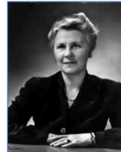
"First Lady" of Al Anon

YANA Clubhouse 770 Aquidneck Ave Middletown, RI 02842